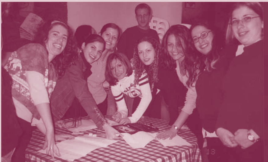
פעילי עו"סים שלום חוגגים

הערב עבר עלינו בפעילות ערה: תוך כדי הפעלות חברתיות למדנו זה על החגים של זה, הכרנו אישית אחד את השני ואכלנו ואכלנו. הערה חשובה: היה טעים.