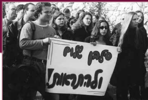
סטודנטים ומרצים בבית הספר בהפגנה נגד המדיניות החברתית-כלכלית, שנה"ל תשס"ב

ובהקשר שלנו, העוני מתקשר לחלק גדול מן הבעיות החברתיות אותן אנו לומדים בבית הספר לעבודה סוציאלית. במקרים רבים העוני גורם לבעיות אלו, ובמקרים מסויימים כמו עבריינות – העוני גם נגרם על ידן. כך או כך העוני כמעט תמיד נמצא ברקע ובסביבת הבעיות האחרות וחיוני שהסטודנטים לעבודה סוציאלית יבינו את גורמיו לשם התערבויות אפקטיביות יותר.