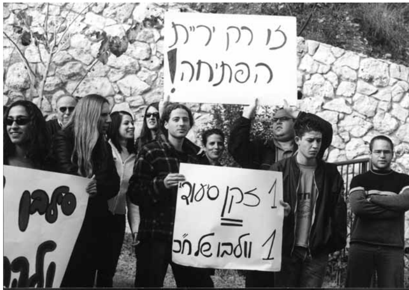
סטודנטים ומרצים בבית הספר בהפגנה נגד המדיניות החברתית-כלכלית, שנה"ל תשס"ב

אדם הרוכש מקצוע ומתפרנס ממנו מקטין את מעגל העוני ומחזק את ערכו העצמי כאדם פרודוקטיבי המפרנס את משפחתו ותורם לחברה. בעצם יציאתו מן הבית לעבודה, הוא מקיים אורח חיים נורמטיבי ויש לו פחות זמן ופחות מוטיבציה לעסוק בפעילויות לא נורמטיביות כמו פשע והתמכרויות. בנוסף, הייאוש, חוסר התקווה, הדכדוך והלחצים הרגשיים פוחתים. זאת לעומת אדם שנמצא במצב של חוסר תעסוקתי מתמשך.